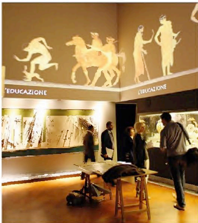
Una delle sale del museo di Spina