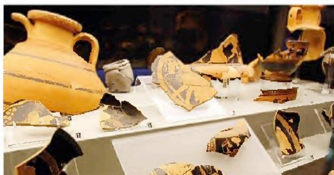
In alto Maisto e la Cornelio, in basso una delle sale del Museo